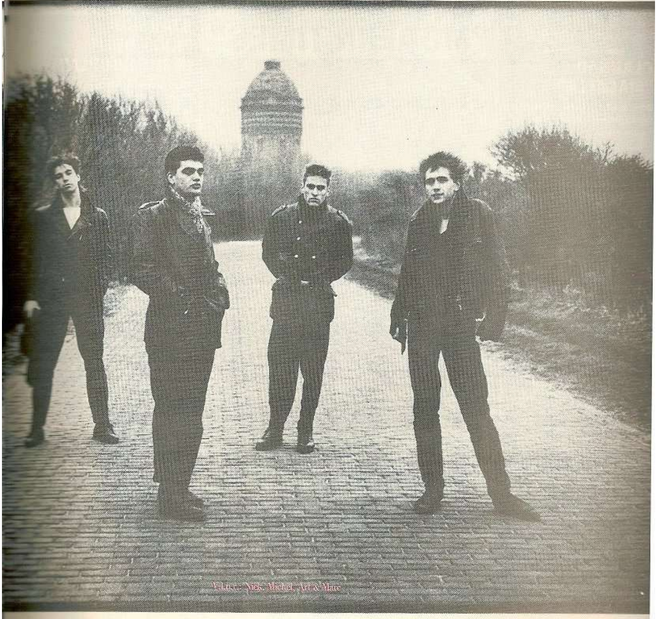
Place: Niek Michel, Art & More